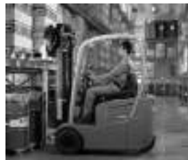
Chariots de manutention